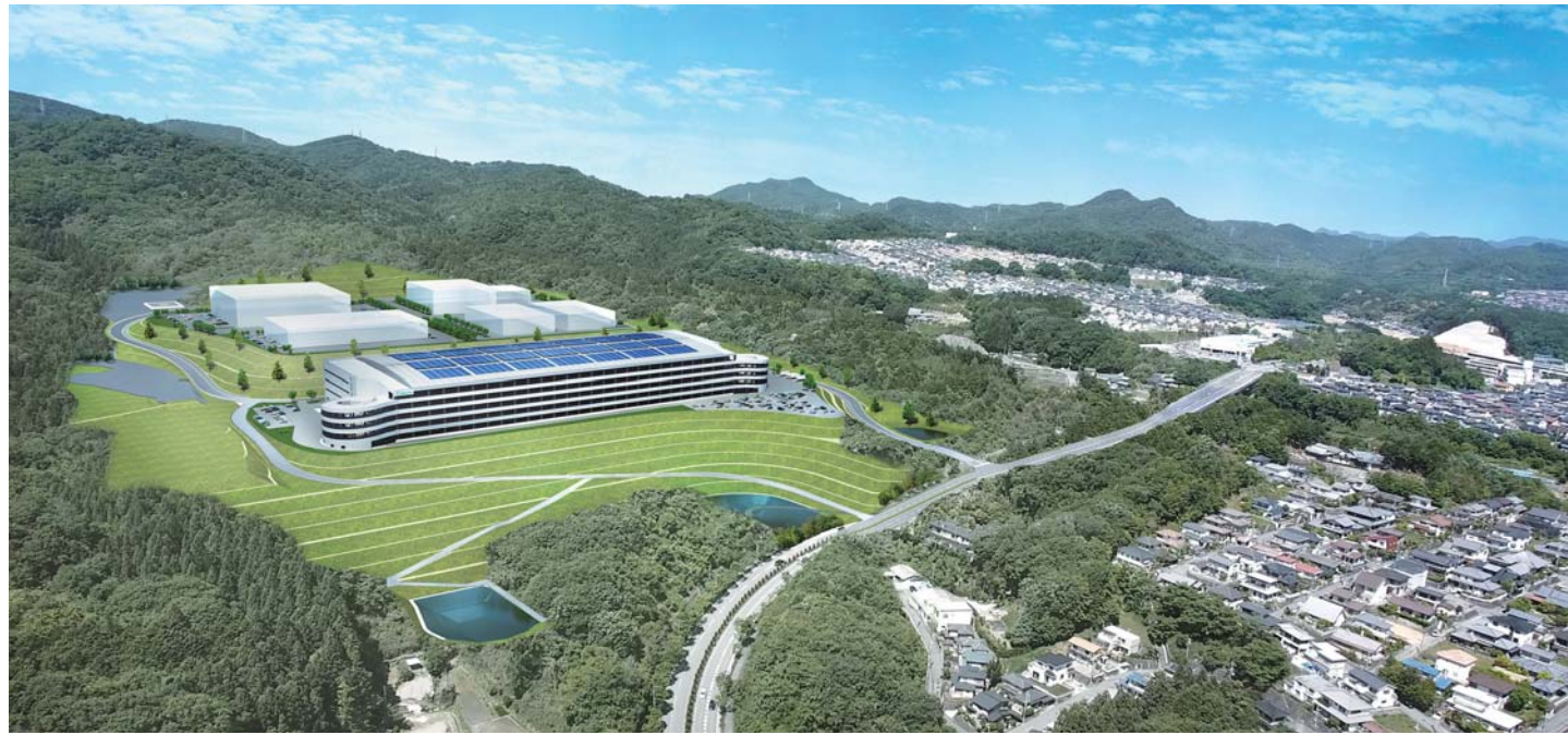
写真は完成イメージです。計画は変更となる場合があります。